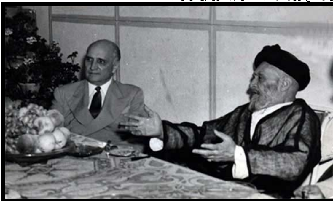
ملاقات کاشانی و لوئی هندرسون

او همچنین شاه را "مرد تربیت شده عاقل" 17 و "مردی معقول تحصیل کرده و با تحصیلات" 18 خواند و گفت: "عقیده من این است که ایران سالیان دراز حساسیت سلطنت دارد و فی الحقیقه وجود شاه یک جهت جمعی برای جمع آوری کلیه طبقات مردم به دور این مرکز ثابت است." 19