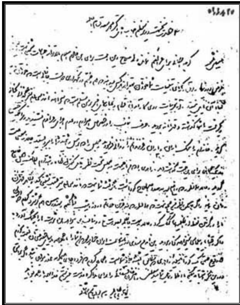
تصویر نامه منسوب به کاشانی در 27 مرداد 1332

و پاسخ نخست وزیر : "مرفومه حضرت آقا وسیله حسن آقا سالمی زیارت شد. اینجانب مستظهر به پشتیبانی ملت ایران هستم." والسلام. دکتر محمد مصدق