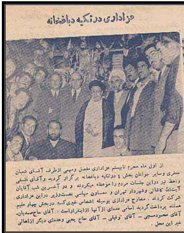
کاشانی و شعبان جعفری (نشسته با لباس تیره زیر پای آیت الله) در تکیه دباغخانه تهران، 2 ماه پس از کودتا 29

"یادم هست روزی که گفتگو بود در بین مردم که مرحوم آیت الله کاشانی حمایت از زاهدی می کند و توطئه ای در کار است پنهانی رفتم منزل ایشان. او در اتاقش تنها بود، بریده ای از خربزه ای را که در دست داشت به عنوان تعارف جلوی من گرفت. گفتم حضرت آیت الله دارند زیر پایت خربزه می گذارند. مواظب باش. گفت "اینطور نیست. من حواسم جمع است... خاطرتون جمع باشه." کاشانی را از مصدق جدا کردند. چند نفری که دور و برش بودند در گوشش گفتند این دکتر پیرمرد است، عقلش کم شده، تو باید جای او را بگیری. باد به آستین او کردند، او را از یک طرف بردند."