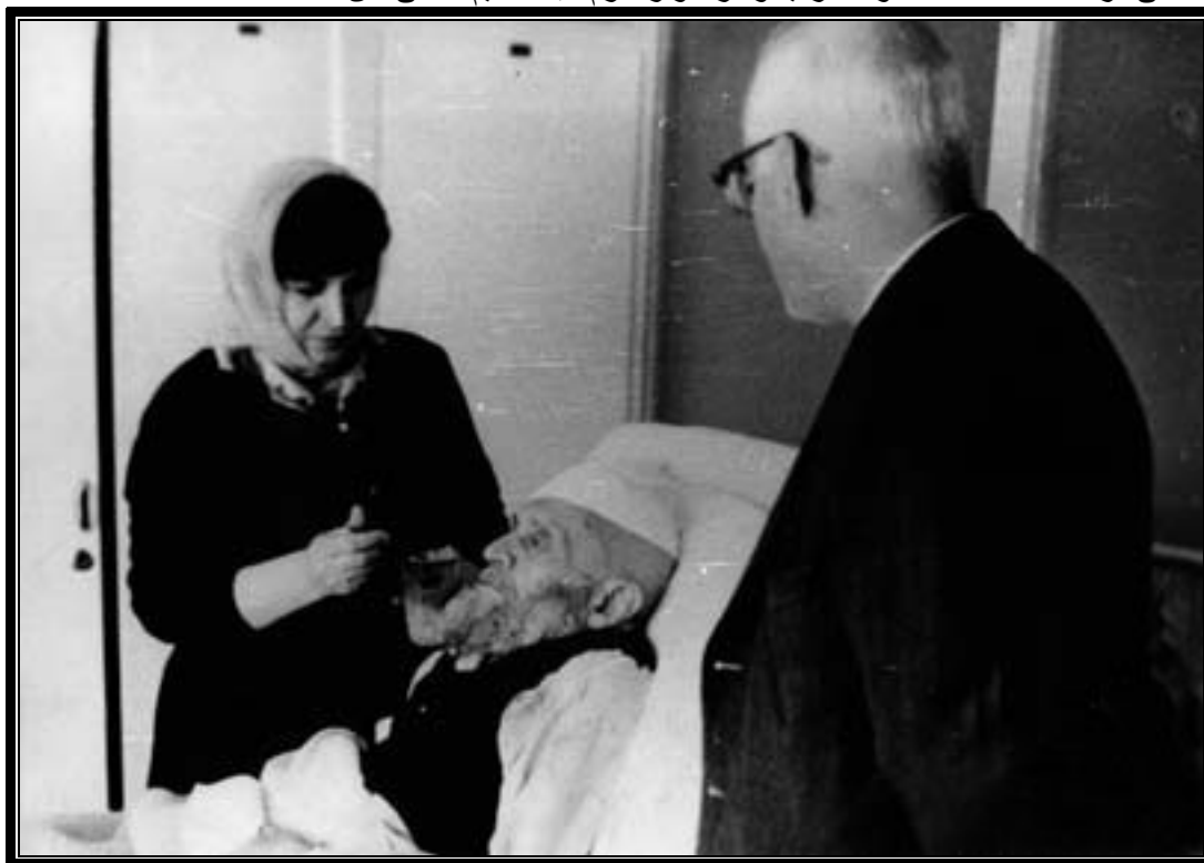
کاشانی در بستر مرگ

قرارداد کنسرسیون نفت، به ملاقات وی رفت 67 و شاه هم در 18 اسفند از او عیادت کرد 68 . سرانجام آیت الله کاشانی در 23 اسفند 1340 فوت گردید و در جوار حرم عبدالعظیم حسنی دفن شد.