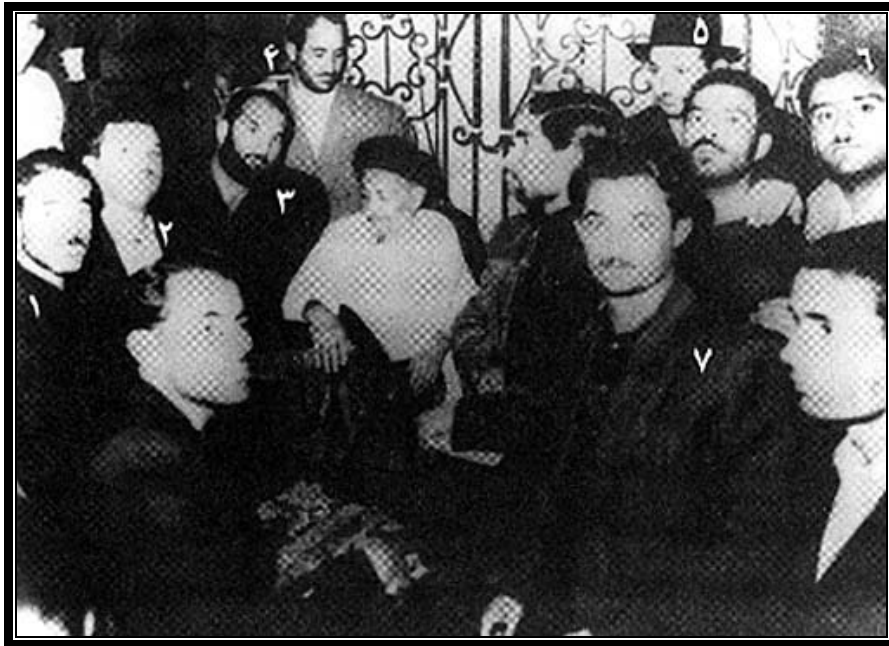
آیت الله کاشانی در جمع مریدان؛ مهدی قصاب، شعبون بی مخ، اکبر خراط و طیب حاج رضایی