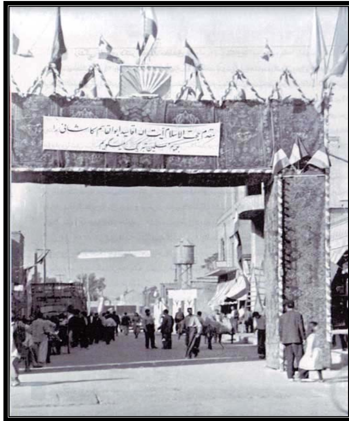
طاق نصرت و اعلام خیر مقدم به مناسبت ورود آیت الله کاشانی از لبنان

با اوج گیری نهضت ملی ایران، آیت الله کاشانی به حمایت از آن پرداخت و در موفقیت و همگانی شدن نهضت نقش عمده ای ایفا ساخت. موضع گیری کاشانی در مورد ملی شدن صنعت نفت روحانیون به نام را به نفع آن برانگیخت. آیت الله خوانساری، آیت الله محلاتی و آیت الله شاهرودی از جمله روحانیونی بودند که به حمایت از ملی شدن صنعت نفت برخاستند.